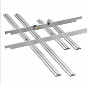
fermacell Abziehlehren-Set Zum Nivellieren von fermacell Schüttungen