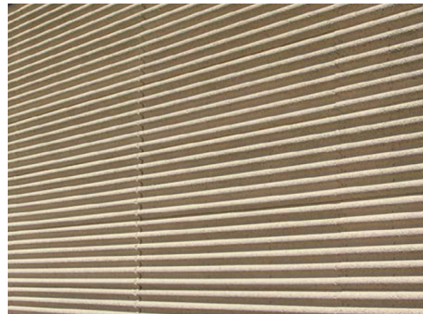
Beispielfoto: WSO 80 nachträglich eingefärbt

Produkt: Mineralisierte (zementgebundene) naturgraue Holzspan-Platte mit schallabsorbierender Oberflächenstruktur. In Anlehnung an die ETA-12/0321