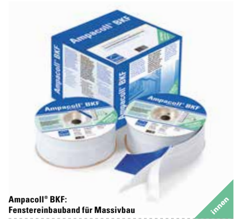
Ampacoll® BKF: Fenstereinbauband für Massivbau