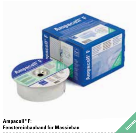
Ampacoll® F: Fenstereinbauband für Massivbau