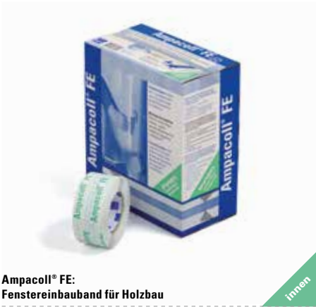
Ampacoll® FE: Fenstereinbauband für Holzbau