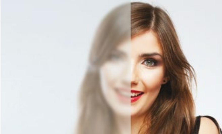
Distanz ca. 10 cm

Diese zeichnet sich durch eine weichere und besser pflegbare Oberfläche aus. Unten sind die unterschiedlichen Transparenzen im Zusammenhang mit der Distanz zum Glas abgebildet.