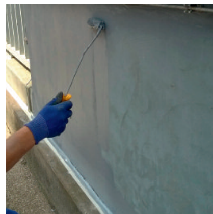
PCI Betonfinish W schützt und verschönt Beton- und Putzfassaden.