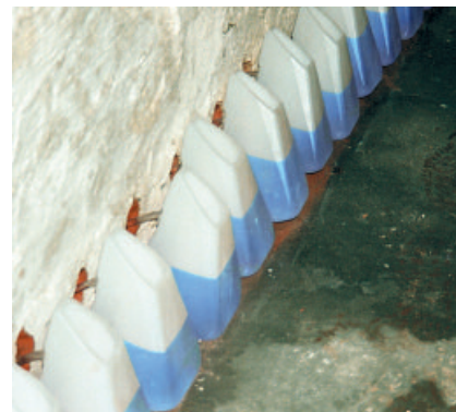
PCI Barra Gisol wird mindestens 24 Stunden lang aus PCI Injektionsbehältern injiziert.