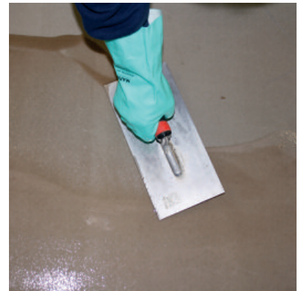
Nur eine geschlossene, porenfreie Kratzspachtelung mit PCI PUR-Grund und einer Quarzsandmischung gewährleistet eine sichere Haftung und blasenfreie Aushärtung von PCI Pursol 1K.

4 Falls PCI Pursol 1K nicht mit Farbchips abgestreut wird, ist ein zweiter Auftrag von PCI Pursol 1K farbig anstelle von PCI Pursol 1K transparent erforderlich.