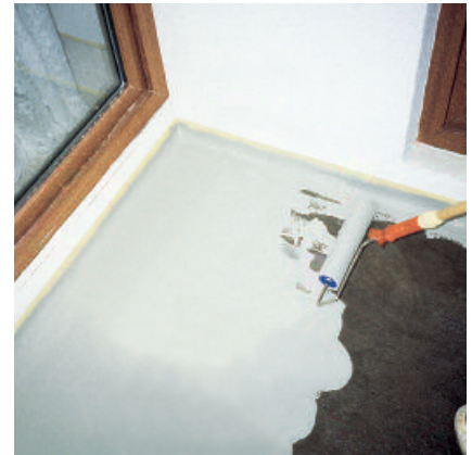
Das rissüberbrückende PCI Pursol 1K ist gebrauchsfertig und leicht mit einer kurzflorigen Rolle zu verarbeiten.