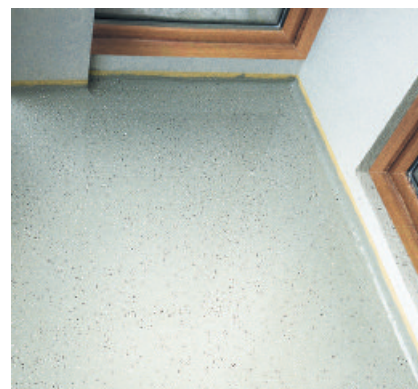
Durch Abstreuen mit Farbchips lassen sich Bodenflächen, z.B. auf Balkonen, mit PCI Pursol 1K dekorativ und individuell gestalten.