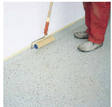
Der mit Farbchips abgestreute erste Auftrag von PCI Pursol 1K farbig muss mit PCI Pursol 1K transparent für einen dauerhaften Schutz nochmals überstrichen werden.