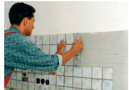
Die Fliesen rutschen nicht ab und können noch einige Zeit ausgerichtet werden.