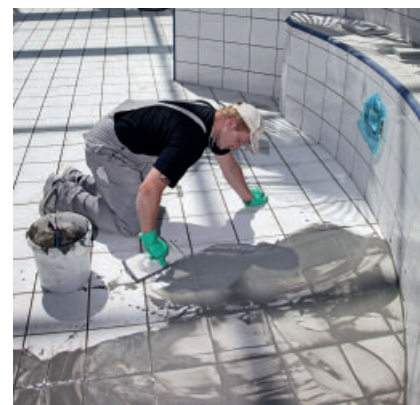
PCI Durafug NT zum Verfugen von keramischen Belägen mit erhöhter mechanischer Belastung und Beanspruchung, z. B. in Schwimmbädern.