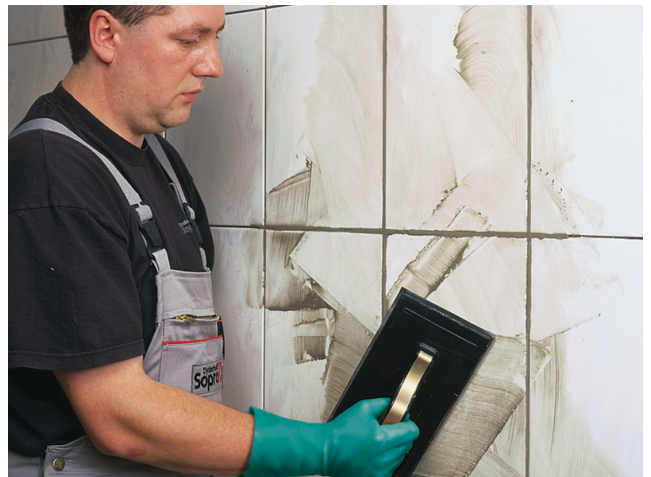
Anschließend wird der Belag mit einem Sopro Fugenmörtel verfugt.