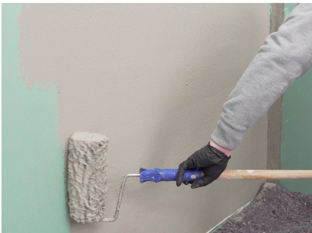
Für ein gleichmäßig deckendes Ergebnis Sopro Fixier- & DichtKleber oder Sopro DichtSchlämme Flex RS im Kreuzgang auftragen.