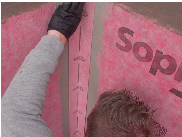
Das passgenau zugeschnittene Sopro AEB® Dichtband Flex (mit Falz) ohne Schlaufenbildung in die frische Klebeschicht einlegen und fest andrücken.