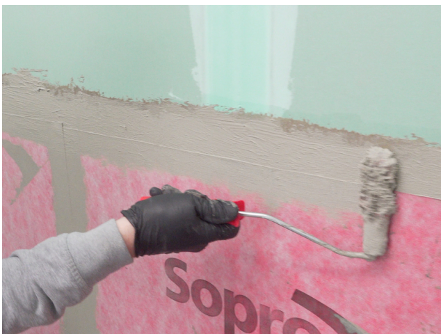
Die Abschlüsse der Sopro AEB® Abdichtungs- und Entkopplungsbahn mit Sopro Fixier- & DichtKleber oder Sopro DichtSchlämme Flex RS überarbeiten.