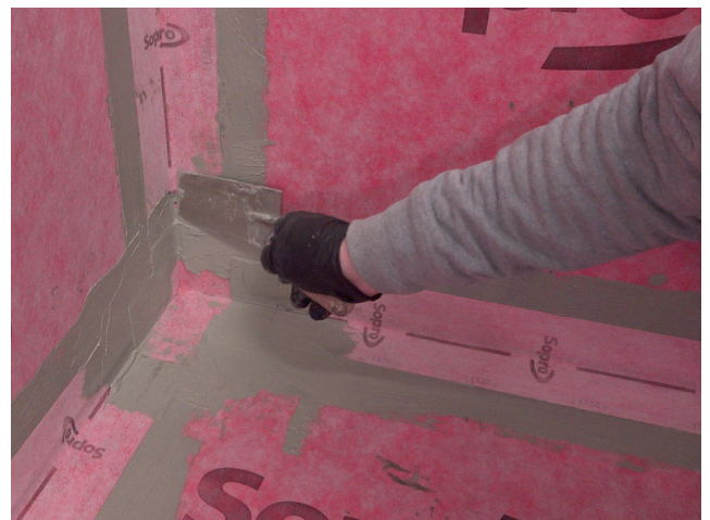
Abschlüsse des AEB® Dichtband Flex (mit Falz) werden im Anschluss mit Sopro Fixier- & DichtKleber oder Sopro DichtSchlämme Flex RS überarbeitet.