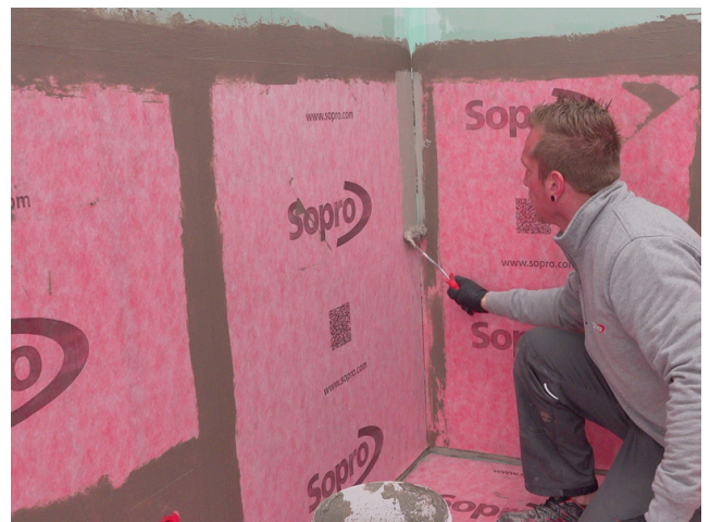
Stoßbereiche der Sopro AEB® Abdichtungs- und Entkopplungsbahn werden mit Sopro AEB® Dichtband Flex (mit Falz) überarbeitet.