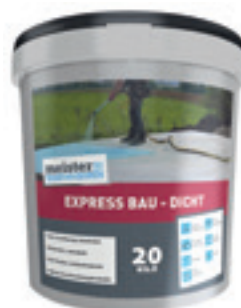
Meister Express Bau-Dicht +30 % Sand als Fliesenverlegemörtel