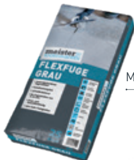
Meister Flexfuge grau