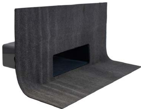
Flansch-Manschette aus Bitumen-Schweißbahn