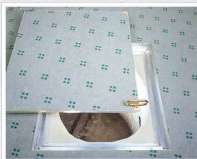
BVA eingebaut in Büro (Putzschacht), ausgelegt mit Teppich